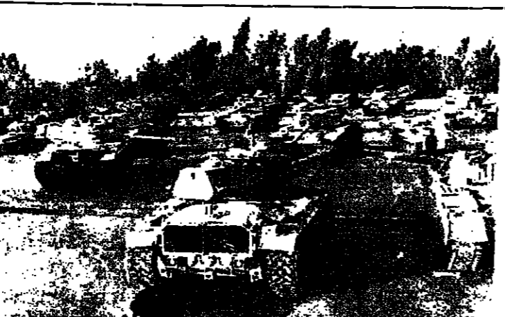
الديابات الأمريكية الصنع التي غنمتها القوات العراقية في حربها مع ايران